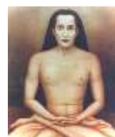
Kriya Babaji Nagaraj