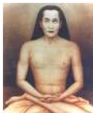
Kriya Babaji Nagaraj